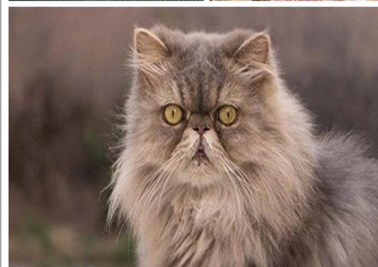
تصویر ۱- برخی از نژادهای معروف گربه: نژاد اسکاتیش فولد (بالا سمت چپ)، نژاد بنگال (بالا سمت راست) و نژاد پرشین (پایین).