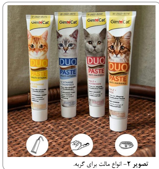
تصویر ۲- انواع مالت برای گربه.

همیشه به یاد داشته باشید که گربه‌های مسن ممکن است دارای بیماری‌هایی باشند که رژیم غذایی نادرست بر تشدید آن‌ها تأثیرگذار است. اکثر افراد به گربه خود غذاهای تر کنسروی، تازه و یا پخته شده می‌دهند تا میزان آب مصرفی گربه افزایش یابد. اگر گربه شما بیماری دارد، در مورد غذای مناسب او حتماً با دامپزشک مشورت نمایید. در مورد تعداد دفعات غذا خوردن یک