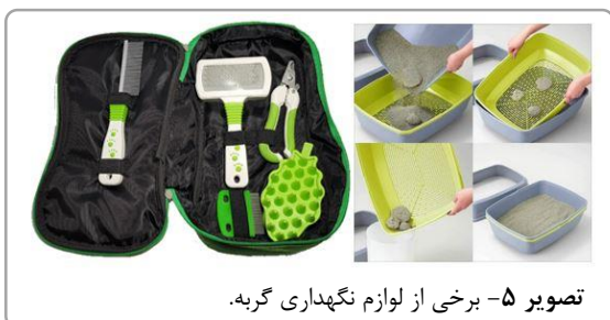
تصویر ۵- برخی از لوازم نگهداری گربه.

گربه‌ها معمولاً خودشان جایی را برای خواب در نظر می‌گیرند. اما اگر اصرار دارید گربه دقیقاً یک جای بخصوص بخوابد، می‌توانید برای او جای خواب بخرید یا خودتان آن را بسازید.