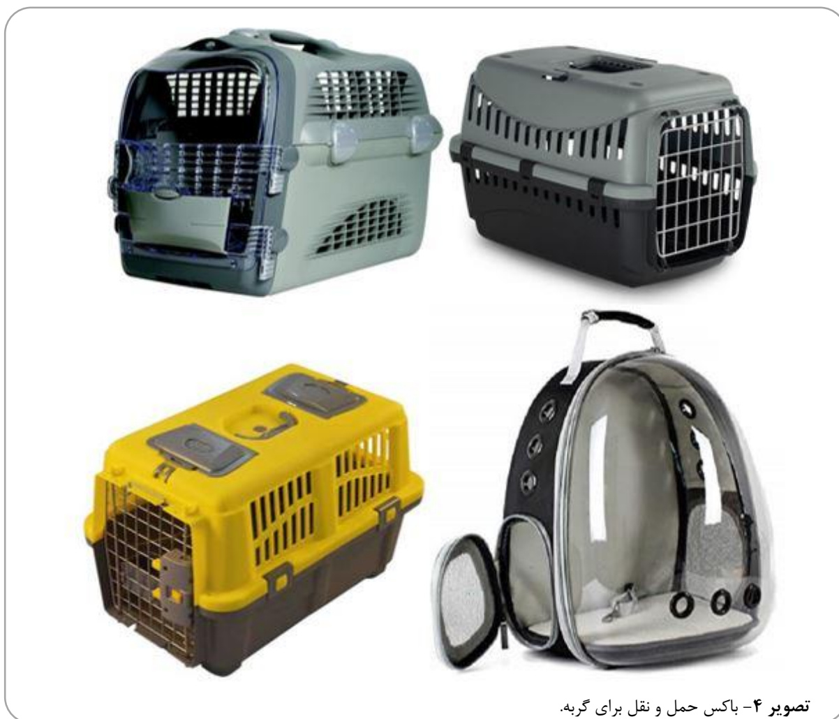
تصویر ۴- باکس حمل و نقل برای گربه.

پس از به دنیا آمدن توله‌ها آن‌ها را در کنار مادرشان قرار دهید و سعی کنید محیطی گرم و آرام برایشان تهیه کنید. در صورتی که توله‌ای ضعیف‌تر است و یا در گرفتن پستان مادرش