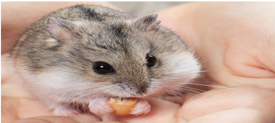
تصویر ۵- طرز گرفتن همستر از زیر بغل و کف دست

۲- گرفتن همستر از زیر بغل و کف دست: این روش بسیار متداول برای گرفتن همستر آشنا است؛ ولی اگر حس