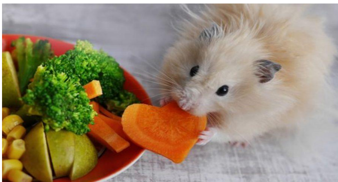
تصویر ۱- تغذیه همستر

دانه‌های خوراکی پرندگان استفاده کرد. توجه داشته باشید که استفاده از این غذاها باید به شکل موقت باشد. حدود ۵۰۰ گرم از این غذاها برای مصرف یک ماه همستر کافی است. همیشه به اندازه مصرف روزانه غذا در قفس حیوان قرار داده شود؛ زیرا غذاهای فاسد می‌توانند سبب اختلالات روده‌ای در همستر گردند. تا جایی که امکان دارد از غذاهایی که حاوی مقدار زیادی آب هستند نباید استفاده کرد. وقتی که از شیر برای رشد همستر استفاده می‌شود، گاهی اثرات غیر قابل پیش‌بینی در هضم غذا می‌گذارد. همستر به غذاهایی مثل سیب‌زمینی، ماکارونی، تخم‌مرغ، برنج، گوشت و ماهی در صورتی که ادویه نداشته باشند تمایل دارد. به طور معمول یک یا دو بار در هفته از میوه و سبزیجات برای تغذیه همستر استفاده می‌شود. پنج درصد از رژیم غذایی یک همستر باید شامل میوه باشد تا نیاز ویتامینی آن تأمین شود. همیشه میوه و سبزیجات را قبل از قرار دادن در داخل قفس همستر باید با آب تازه شست؛ چون ممکن است آغشته به سموم باشند که برای همستر مضر است. اگر قصد ندارید از مواد غذایی موجود در بازار استفاده کنید می‌توانید به جای آن از ترکیب دانه‌ها، حبوبات و آجیل‌های خام بهره ببرید. مصرف میوه‌های پرکالری که موجب مشکلات اضافه وزن، به خصوص در همستر روسی می‌شود را کم کنید. در رابطه با مرکبات احتیاط کنید، چراکه گاهی می‌توانند برای همسترها مواد اسیدی به شمار بیایند.