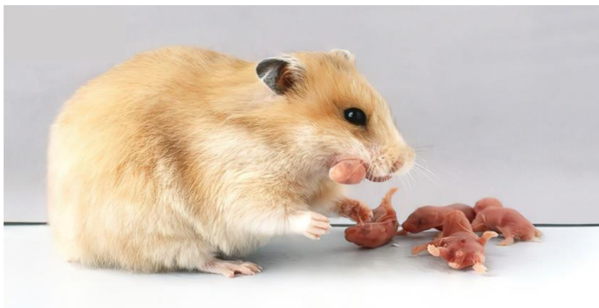
تصویر ۳- بچه خواری در همستر

مادر توسط بچه همسترها و عدم رعایت بهداشت نیز ممکن است باعث ایجاد این رفتار (کشتن بچه همسترها توسط همستر مادر) شود. بچه همسترها در هنگام تولد کر و کور به دنیا می‌آیند. وزن تقریبی آن‌ها در این هنگام دو گرم است. در روز سوم پس از تولد،