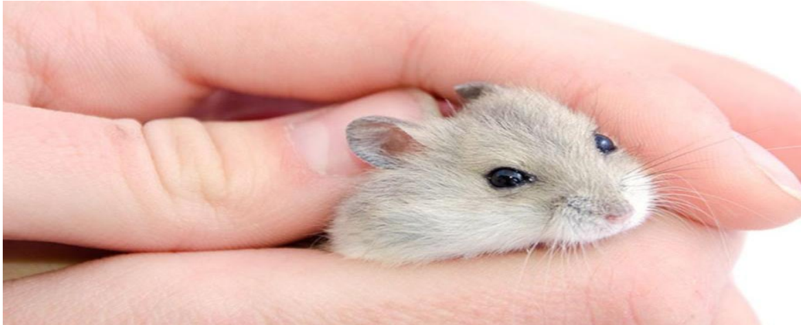
تصویر ۴- طرز گرفتن همستر از پشت گردن

۱- گرفتن از پشت گردن همستر: این روش بیشتر برای همسترهای کوچک و یا همسترهای ناآشنا استفاده