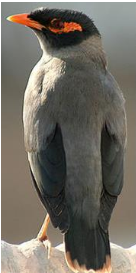
شکل ۴- مرغ مینا