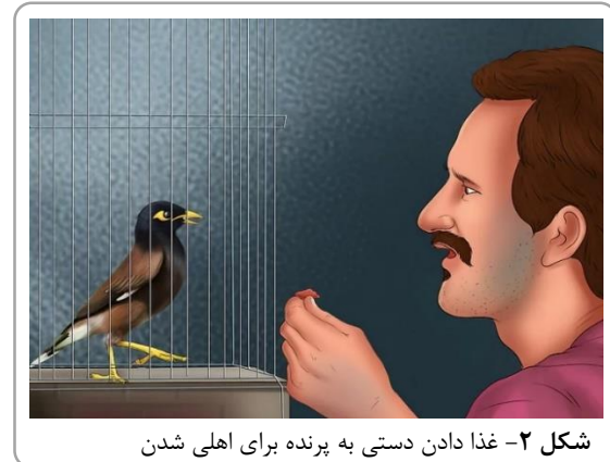
شکل ۲- غذا دادن دستی به پرنده برای اهلی شدن

و امنیت کرده و به این نتیجه برسد که این قفس خانه آینده و همیشگی او است.