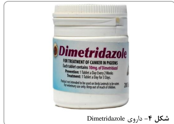
شکل ۴- داروی Dimetridazole

رعایت اصول بهداشتی نگهداری پرنده و تغذیه مناسب، حتی‌الامکان حذف عوامل استرس‌زا و جلوگیری از تماس پرنده خود با پرندگان بیمار، افراط نکردن در مصرف آنتی‌بیوتیک‌ها می‌تواند در پیشگیری از ابتلا مؤثر باشد. در مواقع استفاده طولانی‌مدت از آنتی‌بیوتیک، با توصیه دامپزشک می‌توان ترکیب کلرگزیدین را به آب پرنده اضافه کرد.