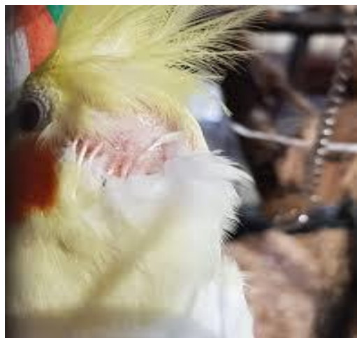
شکل ۸- لکه طاسی در پشت سر پرنده

بیماری: پرندگان بیمار ممکن است پرهای خود را از دست دهند و دچار طاسی موقت شوند. یکی دیگر از علائم این بیماری می‌تواند لکه‌های پوستی متورم یا جوش‌های تاول مانند باشد که از میان پرها بیرون زده و ظاهری شبیه لکه‌های طاس دارند. این بیماری معمولاً علائم دیگری نیز نشان داده و در صورت بهبود پرندگان، طاسی از بین می‌رود (thespruce.com).