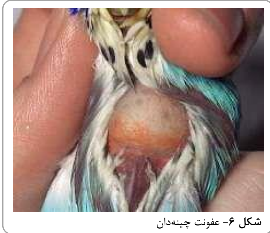
شکل ۶- عفونت چینه‌دان

نوک بالا و پایین بهم می‌رسند) اتفاق می‌افتد. عفونت چینه دان می‌تواند باعث برگشت غذا به دهان، افسردگی، بی‌اشتهایی، تأخیر در تخلیه بموقع چینه‌دان و احتمالاً انباشتگی چینه‌دان همراه باشد (msdvetmanual.com).