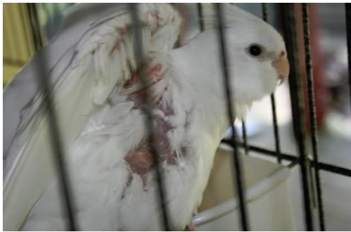
شکل ۳- گندن پره‌های ناحیه زیر بال‌ها

چه سریع‌تر باید پرنده را تحت نظر یک دامپزشک مجرب مداوا نمود.