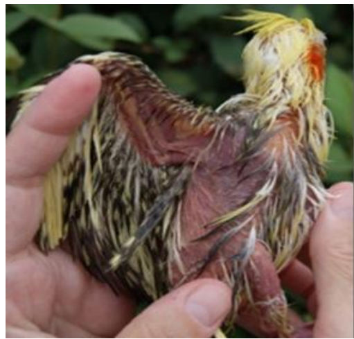
شکل ۲- پرنده دچار خارش شدید در مراحل حاد

مهم‌ترین عوامل انتقال این انگل شامل انتقال از طریق آب آشامیدنی، حمام دادن با آب آلوده، مدفوع و نیز ترشحات بدن پرنده آلوده هستند. البته، نکته مهم در این مورد این است که این انگل، از طریق پوست منتقل نمی‌شود بلکه تنها روش انتقال آن از طریق ورود آب آلوده و آشامیدن است. در ضمن افزودن کلر به آب آشامیدنی این انگل را از بین نبرده و روش اصلی از بین بردن آن جوشاندن آب است.