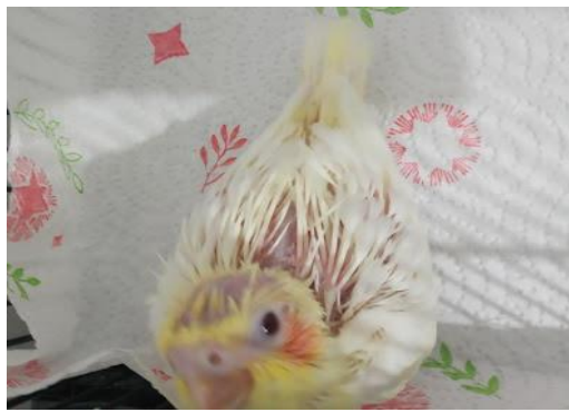
شکل ۷- جوجه در پرریزی

البته برای کمک به پرنده بهتر است انواع ویتامین‌ها، املاح و مواد معدنی، غذاهای مقوی و غیره در جیره غذایی آنها گنجانده شود تا پرهای جدید، به خوبی رشد کنند. در غیر این صورت و در صورت کمبود ویتامین‌ها و مواد معدنی پرهای جدید ناقص در می‌آیند و یا اصلاً رشد نمی‌کنند و ظاهر عروس‌ها زشت و نامتعارف دیده می‌شود (thespruce.com).