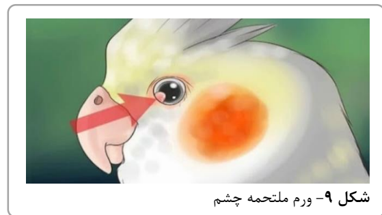
شکل ۹- ورم ملتحمه چشم

یکی از نگرانی‌های اصلی در عروس‌هلندی، عفونت چشم است. علت التهاب یا عفونت ملتحمه، تاکنون دقیق مشخص نشده است و تحقیقات در مورد علت و درمان ورم ملتحمه چشم عروس‌هلندی ادامه دارد. هرگونه مشکل چشمی در کوکاتیل باید توسط دامپزشک پرندگان بررسی شود تا بیماری تشخیص داده شود. ملتحمه بافتی بین چشم پرنده و پلک آن است که در حالت طبیعی قابل مشاهده نبوده و در پرنده سالم به رنگ صورتی روشن است. ورم ملتحمه زمانی اتفاق می‌افتد که ملتحمه متورم و قابل مشاهده شود.