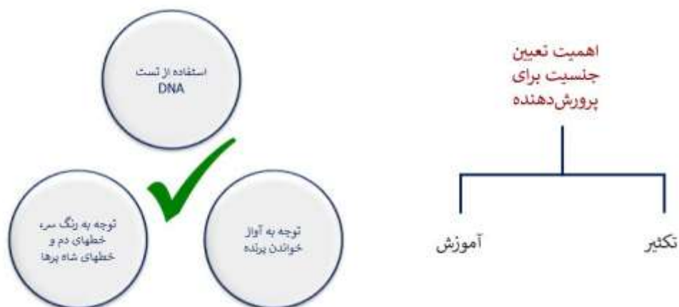
شکل ۵- اهمیت و راهکارهای تعیین جنسیت.