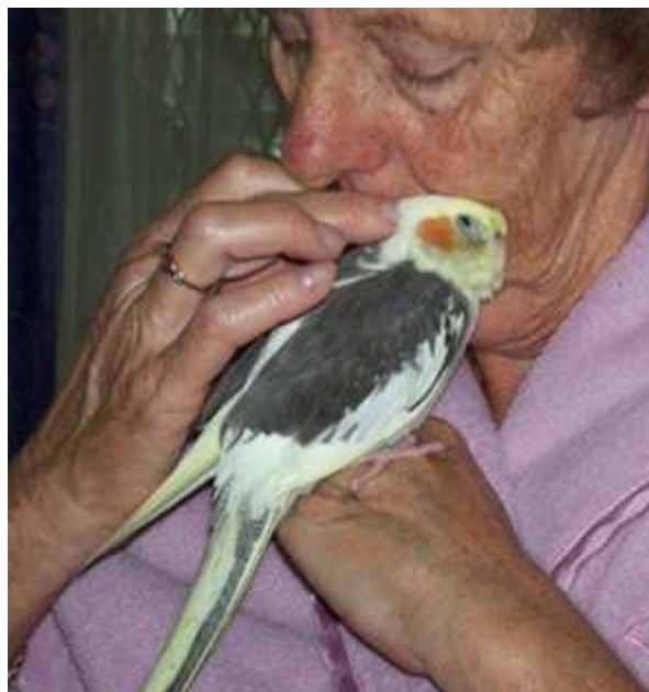
شکل ۱- نقش درمانی عروس هلندی.

عروس هلندی در طبیعت در دسته‌های ۲ تا ۱۲ تایی دیده می‌شود (شکل ۳). زیستگاه آن، چمنزارهای وسیع و دشت‌های پهناور است. آن‌ها برای تأمین آب مورد نیاز خود به باران‌های فصلی نیاز دارند و از جوانه‌ها و سایر گیاهان تغذیه می‌کنند. این پرنده در طبیعت، در اوایل صبح و اواخر بعد از ظهر بسیار فعال است و معمولاً در این زمان برای نوشیدن آب راهی برکه‌ها می‌شوند. در طول روز به دنبال