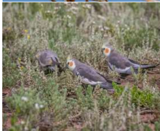
شکل ۳- زندگی گروهی عروس هلندی در طبیعت.