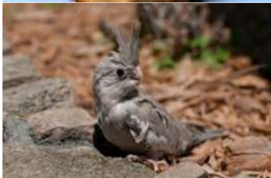
شکل ۴- جوجه‌های تازه متولد شده عروس هلندی