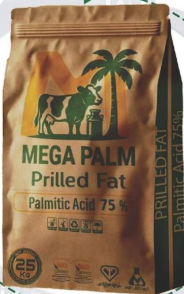
● پودر چربی مگاپالم

پودر چربی کلسیمی با 40 درصد پالمیتیک و اولئیک پروفایل مناسب برای فصل گرم