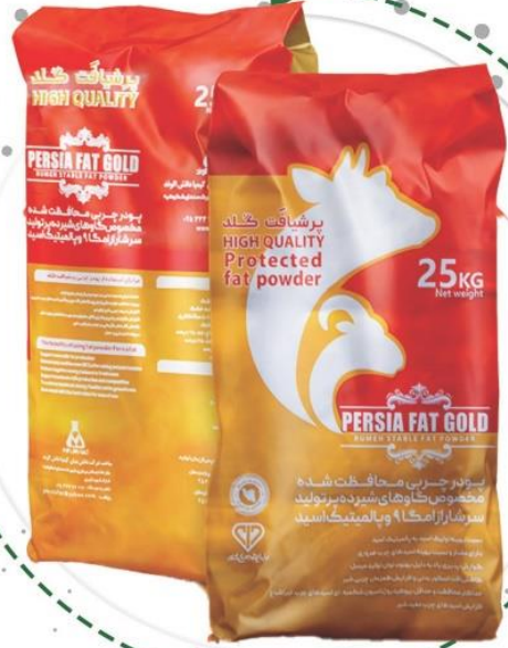
● پرشیافت گلد

با ۴۰، ۵۰، یا ۶۰ درصد پالمیتیک استید قابلیت هضم بیشتر درصد چربی شیر بالاتر