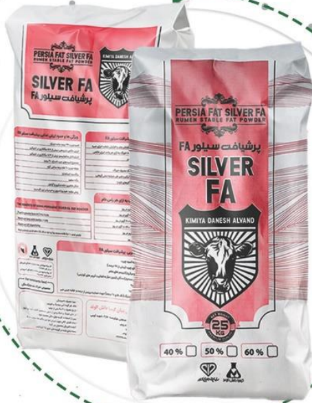
● پرشیافت سیلور بر پایه چرب SILVER FA

با ۴۰، ۵۰، یا ۶۰ درصد پالمیتیک استید قابلیت هضم بیشتر درصد چربی شیر بالاتر