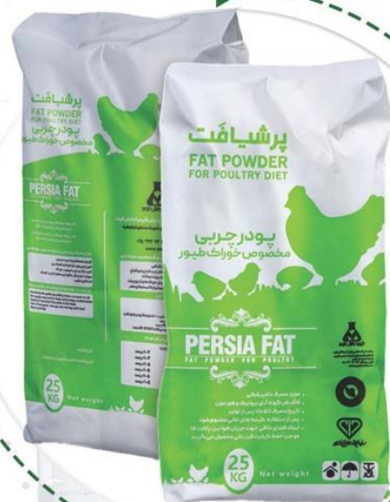
● پرشیافت طیوری