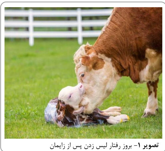
تصویر ۱- بروز رفتار لیس زدن پس از زایمان

زایمان، رفتارهای دفاعی نسبت به گوساله از خود نشان می‌دهند. گاوهای شکم دوم رفتارهای تهاجمی در مقابل انسان‌ها هنگام جدا شدن گوساله دارند و گاوهای شکم اول آرام هستند؛ در حالی که هر دو گروه رفتارهای دفاعی را نشان می‌دهند (Vicentini et al., 2022). اگرچه هورمون‌ها جهت بروز رفتار مادرانه ضروری نیستند، اما می‌توانند بر آن تأثیر داشته باشند (Saltzman and Maestripieri, 2010). کمبود اُکسی‌توسین در تلیسه‌ها می‌تواند منجر به کاهش رفتارهای مادرانه شود (Kurpineska and Skrzypczak, 2019; Neave et al., 2024; Javed et al., 2023). علاوه بر این، اُکسی‌توسین می‌تواند اثر ضد اضطرابی داشته باشد که منجر می‌شود مادر نسبت به نوزاد بیشتر واکنش نشان دهد (Mota-Rojas et al., 2025). به نظر می‌رسد افزایش غلظت کورتیزول در گردش خون، برانگیختگی و پاسخگویی به محرک‌های نوزاد را در ماده‌های جوان و نسبتاً بی‌تجربه افزایش می‌دهد، اما ممکن است بروز رفتار مادرانه را در مادران مسن‌تر و باتجربه‌تر مختل کند (Saltzman and Maestripieri, 2010). علاوه بر این، کورتیزول می‌تواند تشریح اُکسی‌توسین را مهار کند که منجر به کاهش رفتارهای مادرانه می‌شود (Mota-Rojas et al., 2025).