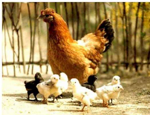
تصویر ۳- نگهداری مادر از جوجه‌ها

زیرا این رفتار در اثر اصلاح نژاد صنعتی تا حد زیادی حذف شده است. با این حال، در شرایط پرورش تجاری می‌توان روش‌هایی را به کار برد که بدون مادر بودن جوجه تأثیر کمتری در شرایط پرورش بگذارد. به عنوان مثال، پخش صدای کلک کردن مادر (Maternal cluck calls) می‌تواند در کاهش استرس جوجه‌ها مؤثر باشد، به خصوص اگر این صداها با شدت و مدت مناسب پخش شوند. علاوه بر این، صدای غذا دادن (Food calls) می‌تواند جوجه‌ها را به سمت غذا جذب کند و منجر به باعث افزایش وزن و بهبود ضریب تبدیل خوراک شود. صدای خوابیدن (Roosting calls) نیز برای تشویق جوجه‌ها به استراحت و ایجاد ریتم رفتاری هماهنگ مفید است.