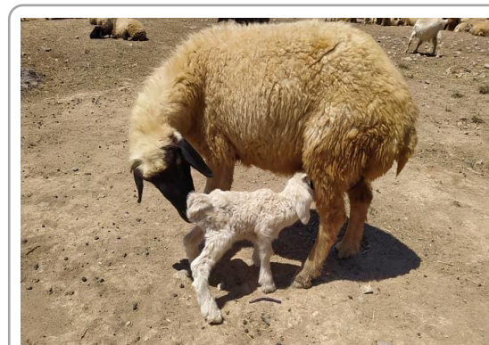
تصویر ۲- شیر خوردن بره از میش

رفتار مادرانه، نقش‌زنی و پیوند اجتماعی نقش دارد (Mota-Rojas et al., 2023). این هورمون از طریق تعامل با گیرنده‌های خود در مغز، رفتارهای پیوندی را تقویت می‌کند و مراقبت والدینی جایگزین را تحت تأثیر قرار می‌دهد (Mota-Rojas et al., 2023). علاوه بر آکسی‌توسین، هورمون‌های دیگری مانند پرولاکتین، کورتیزول و پروستاگلاندین در فرآیند زایمان و پیوند دخیل هستند (Mota-Rojas et al., 2023). در گوسفندان، پیوند اولیه در دوره حساس چهار ساعته پس از تولد برقرار می‌شود، جایی که میش سیگنال‌های متمایزی مانند بوی مایع آمینوتیک را به بره نقش می‌زند و بره نیز از طریق نشانه‌های بویایی، بینایی و صوتی مادر را می‌شناسد. پس از این دوره، میش به طور انتخابی فقط بره خود را می‌پذیرد و غریبه‌ها را رد می‌کند (Mora-Molina et al., 2016). اختلال در پیوند میش- بره پس از زایمان، یکی از عوامل مرگ و میر در بره‌ها در روزهای ابتدایی تولد است. تغذیه ناکافی مادر منجر به تأثیر منفی بر رفتار میش- بره پس از زایمان می‌گردد. میزان آغوز مصرف شده توسط بره به پیوند میش- بره پس از تولد بستگی دارد. در صورتی که آغوز مادر ویسکوزیته پایینی داشته باشد منجر به مکیدن آسان‌تر بره می‌شود. مکمل‌های پر انرژی که اواخر آبستنی به میش‌ها داده می‌شود، رفتارهای مادرانه را در میش‌ها در ساعات اولیه تولد بره تقویت می‌کند (Villar et al., 2023). بروز تیمار در نژاد نوردوز ترکیه می‌تواند تحت تأثیر تعداد زایمان نباشد (Mota-Rojas et al., 2025). به طور کلی، این مکانیسم‌های هورمونی و حسی با یکدیگر تعامل دارند تا پیوند را تثبیت کنند و اختلال در هر کدام می‌تواند رفاه بره را مختل سازد.